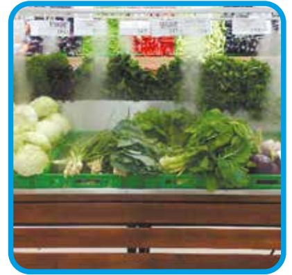
Endüstriyel ve Bahçe Nemlendirme