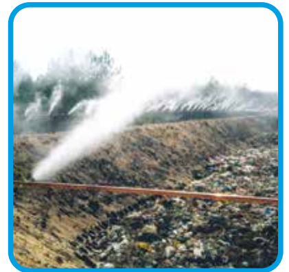
Koku ve Toz Bastırma