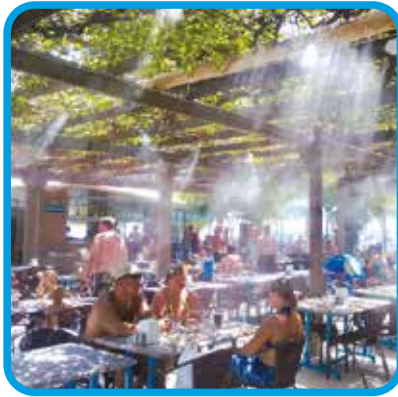
Açık Hava Serinletilmesi