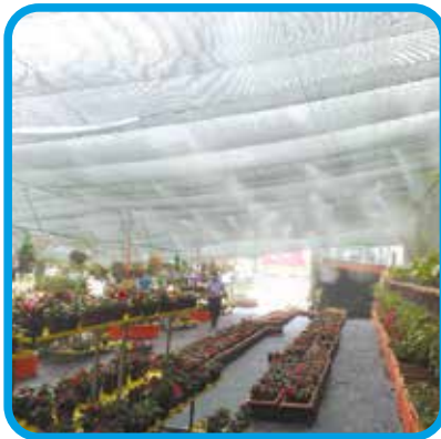
Sera ve Tarım Uygulamaları