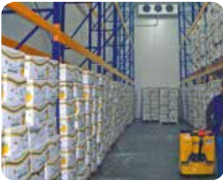
Gıda Üretim ve Depoları