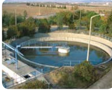
Atıksu Arıtma Tesisleri