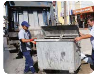
Çöp Kamyonları ve Konteynerleri