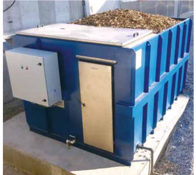
Fethiye / Solar Çamur Kurutma Tesisi Koku giderim sistemi - 2012